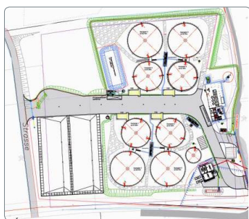
Lageplan Biogasanlage Schöpstal

Damit wurde ein weiteres zukunftsweisendes Doric Green Power Projekt erfolgreich umgesetzt, das einen wichtigen Beitrag leistet für die Umwelt, sichere Arbeitsplätze und die Förderung landwirtschaftlicher Strukturen der Region Oberlausitz.