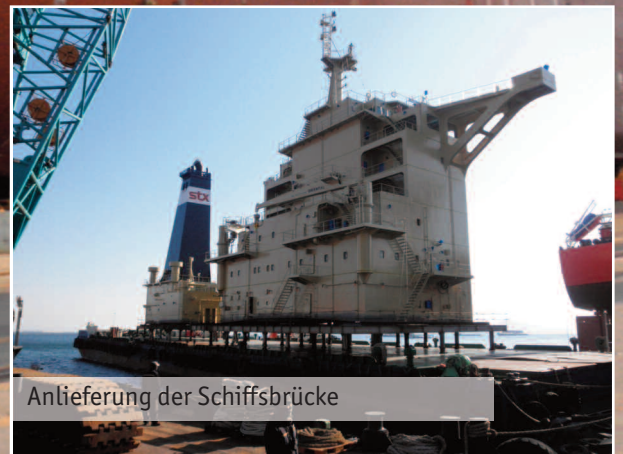
Anlieferung der Schiffsbrücke