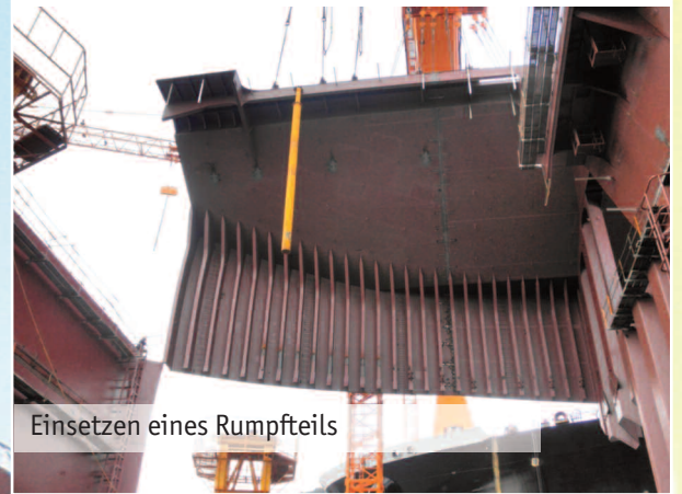
Einsetzen eines Rumpfteils