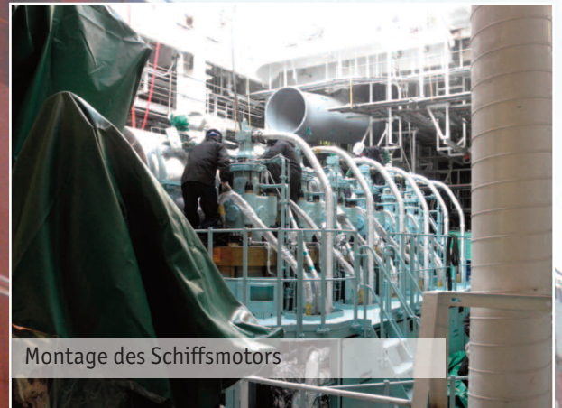
Montage des Schiffsmotors